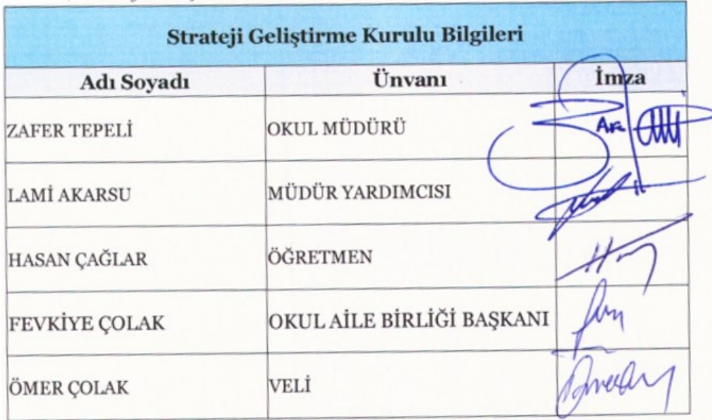
Tablo 27. Strateji Geliřtirme Kurulu