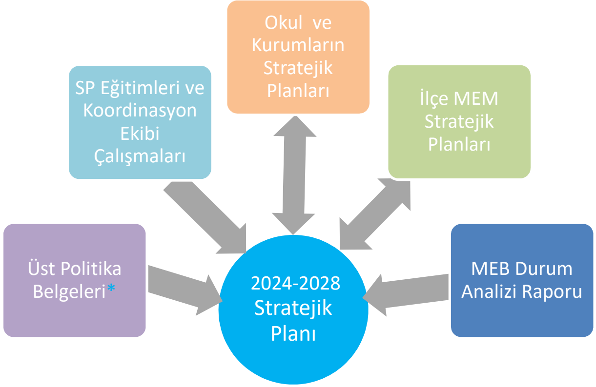
Şekil 1 - Stratejik Plan Oluşum Şeması